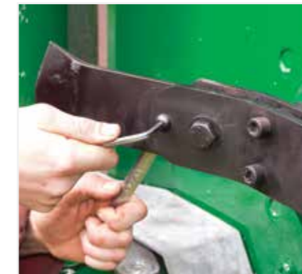
Sistema due lame in una: rigido e oscillante