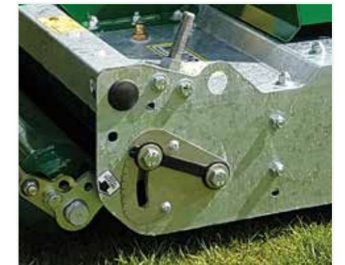
Sistema di regolazione dell'altezza oscillante