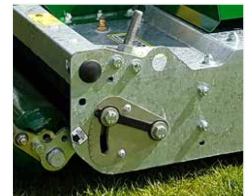
Sistema di regolazione dell'altezza