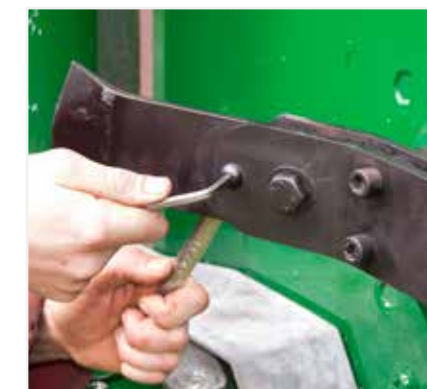
Sistema due lame in una: rigido e oscillante