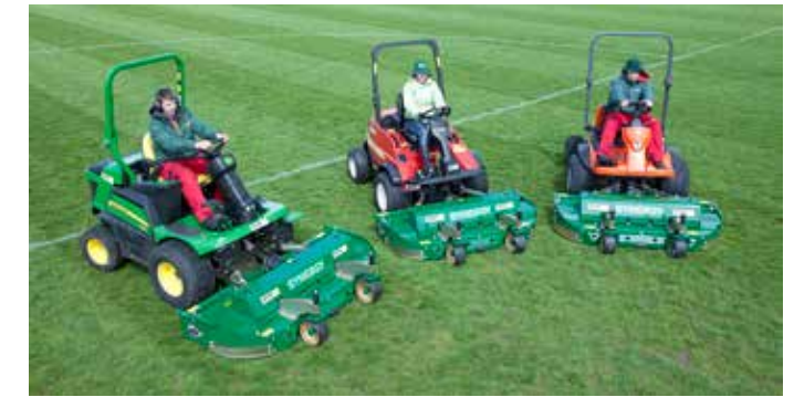
Synergie aandrijflijn met stand maaimessen