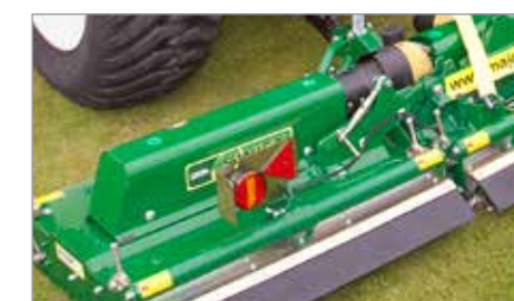
Kit luci stradale