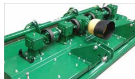
Hnací ústrojí poháněné ozubeným kolem

Tako dostupné u verze s přední montáží, viz strana 12.