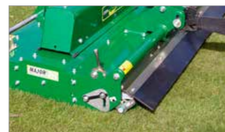
Systém nastavení výšky