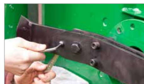
Systém břitů dva v jednom, pevný a výkyvný