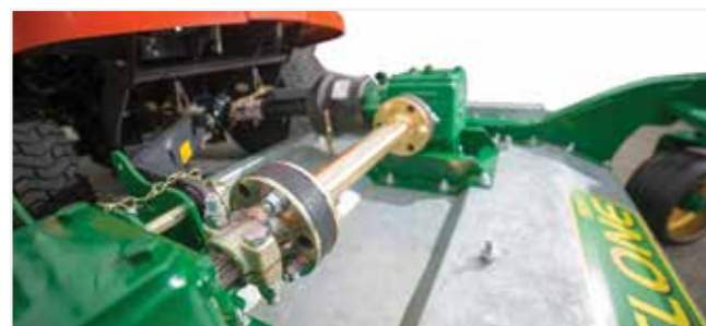
Degelijke aandrijving voorzien van zware tandwielkasten.