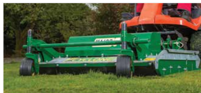
Een professioneel maaibeeld in zowel lang als kort gras