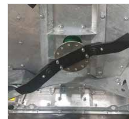
Système de lame deux en un, rigide et en balancier