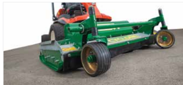
Sistema di regolazione dell'altezza di taglio da 10 a 110 mm