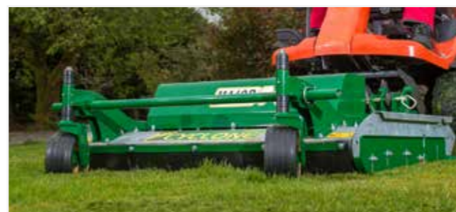
Una finitura professionale per i terreni complessi e i manti erbosi sottili