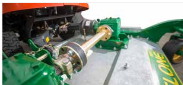
Struttura robusta e sistema di trasmissione a ingranaggi per impieghi gravosi